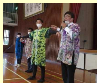
ボツワナの民族衣装紹介

所長は青年海外協力隊として、ボツワナの学校でコンピュータに関する指導をされた経験があります。両国の食文化の違いを例にして、国際化が進む世界で生きる心構えとして、「すべてのことを受け入れる柔軟な気持ち」「文化の違いを楽しむこと」が大切であると教えていただきました。