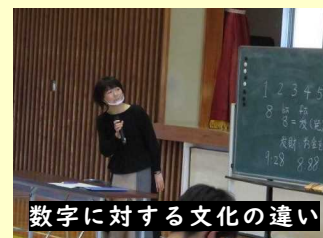
数字に対する文化の違い

さんは、来日したときは日本語を話せない状態だったので、大変苦労したそうです。その苦労の中には、日本人と中国人は見た目には似ていても、文化の違いがあるところから生じるものもあったとのことで、数字をキーワードに両国の文化の違いを教えていただきました。