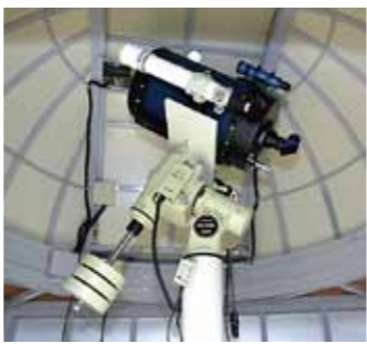
▲シムミットカセグレン式天体望遠鏡