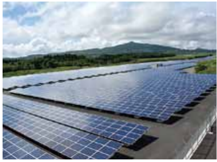
▲展望デッキから見たソーラーパネル

・研修室(枕崎ヘリポートタ1ミナルビル1階) 大型モニターで、現在の発電量や発電所のシステムを約15分のビデオで紹介します。