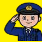
うそ電話詐欺抑止対策係 係長