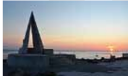
▲朝日がきれいに見える宗谷岬

また、稚内は宗谷岬とノシ ヤツ岬の2つの岬に挟まれ た湾のよう な地形をし ていますの で、その両 岬からの朝 日や夕日も 絶景です。