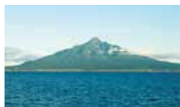
▲最北の利尻山に登ってみては？ （通称 利尻富士）

この時期は、稚内からフェリ ーで約2時 間、利尻島 にある利尻 山（標高1 721m） への登山客 でにぎわい ▲最北の利尻山に登ってみては？ （通称 利尻富士）