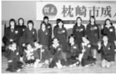
▲ボランティアに参加した子どもたち

皆さんに式を支えていただき、盛大に行うことが出来ましたとお礼のことばも述べられました。