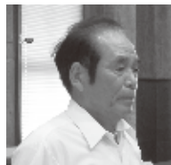
禰 占通 議員