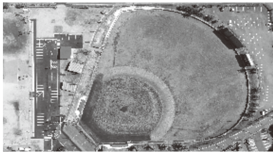
多目的な活用が可能な施設へと整備が進む市営野球場