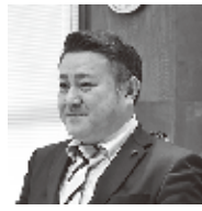
永野 慶一郎 議員