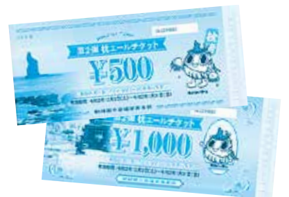
「枕エールチケット」

答 令和3年度に向けて、飲食業組合等の皆さんの声を聞きながら支援事業を実施していきたい。