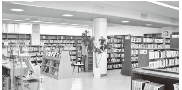
リニューアルオープンした市立図書館

問 今回の改正によるものですか。今回の改正により医療費助成に係る住民税非課税世帯の対象者がどのように変わるのか。