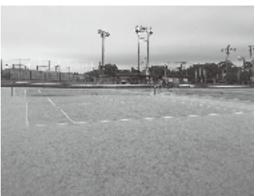
塩浜テニスコート