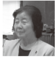
豊留 榮子 議員