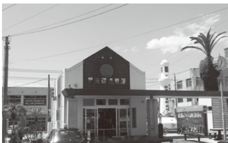
枕崎駅前観光案内所