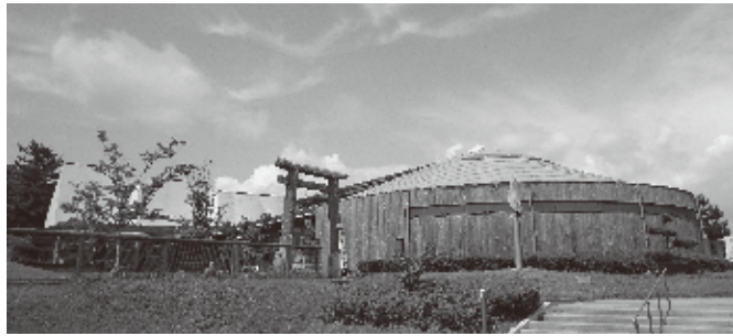
スポーツ・文化振興課の事務所は南浜館内となる予定

議案第83号及び議案第84号は関連があり一括して審査しました。 今回の組織機構の見直しの目的等は、本市が人口減少や少子高齢化、地域コミュニティの希薄化といった地域課題を抱える中、スポーツ振興・文化振興には、市民の生きがいづくりや市民同士の交流促進、地域コミュニティの形成などに加え、スポーツや文化をまちづくりのための資源として磨きをかけ、地域の魅力向上や活性化と、それらによる関係人口の増加につなげるなどこれまで以上に多面的で大きな役割を担うことが期待されており、これらの課題への対応として、スポーツ・文化に関する事務事業を教育委員会から市長事務部局に移管し、一元化すること、スポーツ・文化振興に向けた総合的な施策展開を図り、教育はもとより、観光、地域づくり、福祉、健康など多様な分野と連携し、取組の充実を目指すこととしているとのことです。