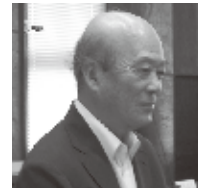
立石 幸徳 議員