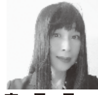
議員 子 君 東