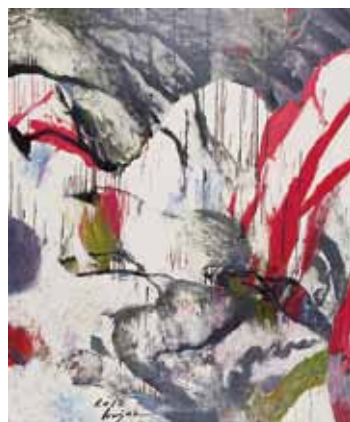
▲「オニの棲家」(油彩画) 南浜館寄贈作品