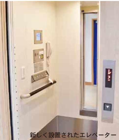
新しく設置されたエレベーター

1階から2階にかけてはエレベーターが設置され、階段を上り下りすることへの負担がなくなりました。