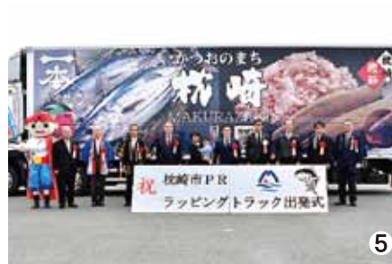
①出発を記念してテープカットが行われました。 ②特産品が並んだ右面 ③港まつりをPRする背面 ④南代表取締役へ花束贈呈 ⑤関係者一同で記念撮影