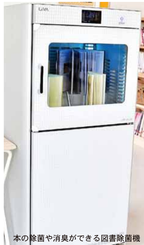
本の除菌や消臭ができる図書除菌機