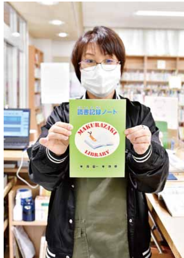
自分なりに感想や思い出を書き込むことができる読書記録ノート

図書館のオンライン化により、新しく「読書記録ノート」も導入しました。読書記録ノートは、本を借りた際に貸し出し記録をシール形式で出力し、ノートに貼ることで、借りた本の記録を残すことができます。ノートの余白部分に感想などを書き込むことができ、後々、その当時から振り返ることができます。 既に読書記録ノートを使用している方からは、「子どもの読書記録が残ることがうれしい」といった声があるそうです。自分だけのオリジナルノートを作ってみてはいかがでしょうか。