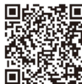
▲県河川砂防情報システム

希望者は、「枕崎市会計年度任用職員申込書兼履歴書」(様式あり)に必要事項を記入し、84円切手を貼った宛先明記の返信用封筒(長形3号)を添付して、福祉課課係まで提出してください。