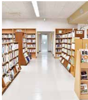
一般閲覧室(1階フロアー)