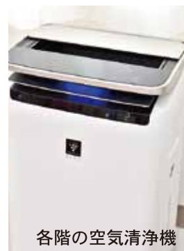
各階の空気清浄機

本は不特定多数の人が触れ、棚に置いておくだけでもほこりが付くこともあります。そこで、本をより清潔に保つために、新たに図書除菌機を導入しました。図書除菌機は本を入れ、紫外線を30秒間照射することで、ページの中で除菌することができます。また、消臭抗菌剤が循環しているため、たばこの臭いやペットの臭いなどを除去することもできます。本に挟まった髪の毛やほこりなども除去することができ、本をより衛生的に使用することができるようになりました。