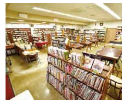
▲リニューアル前の図書館

しかし、開館から約40年が経過した図書館は、雨漏りによる壁や本棚の腐食、トイレの老朽化など、さまざまな問題が発生していました。今回、利用者の皆さんにとって、より利用しやすい図書館にするため、改修工事が行われました。