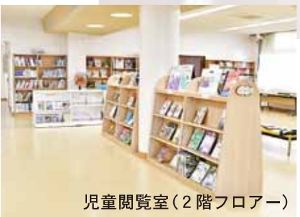
児童閲覧室(2階フロアー)