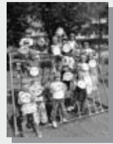
市立保育所最後の卒園児による「子どもの絵」