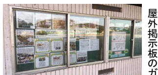
屋外掲示板的ガラス

※ グラウンド(フィールドやトラック内)については、管理・保全の観点から原則として車の進入・駐車などができなくなりました。