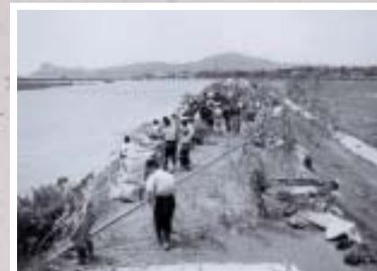
花渡川の堤防（昭和29年8月）

■はっきりとはわかりませんが、川の決壊を防ぐために土のうを積んでいる様子だと思われます。この年の8月、台風5号により、風水害が発生したと資料には記載されています。