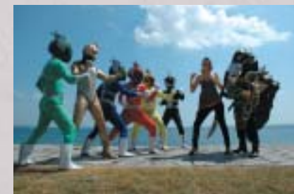
登場するシーンは9月27日、火之神公園で撮影されました。

ついにインターネットTVドラマに出演する『カツオジャー』。彼らの活躍はついに全国区へ!?