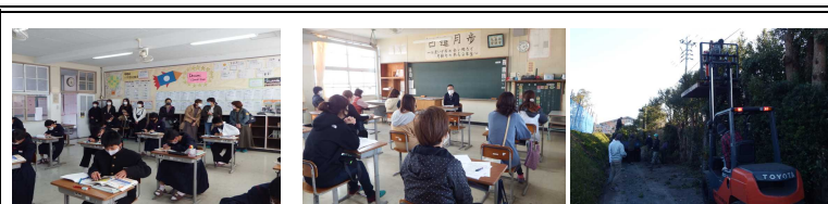
授業参観 学級PTA 強剪定作業