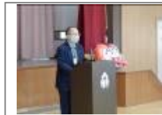
人権の花運動(市総務課等)