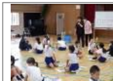
認知症キッズサポーター講座