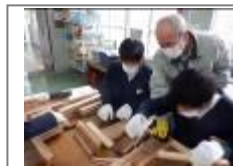
木工教室(地域振興局・農政課)