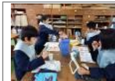
歯磨き指導(保健師)