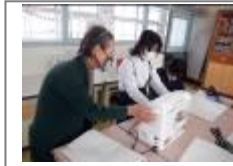
ミシンの授業(学校応援団)