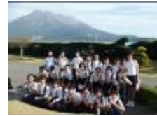
仙巖園(桜島をバックに)

例年は熊本方面を訪れる修学旅行も、今年は、新型コロナウイルス感染症の影響で、大隅半島や霧島市、鹿児島市へと訪問地を変えての実施となりました。まさかのバラの花よりゴーカート(鹿屋市)。マイナスイオンをいっぱい浴びた雄大な滝(錦江町)。ふるさと鹿児島市の素晴らしさを改めて実感した歴史・文化施設(鹿屋市、鹿児島市、霧島市)。広々とした温泉・部屋、おいしい食事を堪能したホテル(垂水市)。何度もおかわりに行ったホテルバイキング(霧島市)。