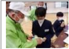
ものづくり(県技能協会)