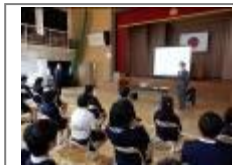
薬物乱用防止教室(薬剤師)