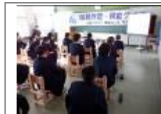
租税教室(南薩法人会等)

11月から12月にかけて、学校応援団や外部講師の方々、中学校の先生による学習(授業)がたくさん行われました。それぞれの専門性を生かし、子供たちに多様な学びの機会を提供していただきました。ここに、ご紹介します。