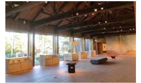
靴のまま館内に入れるようになりました(南浜館)