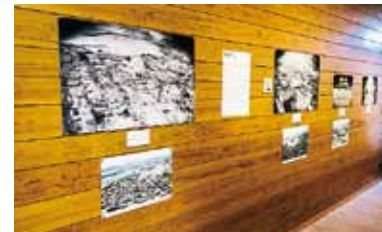
枕崎空襲と現在の写真

夏休みの企画展として8月5日から8月20日まで開催。枕崎空襲で市街地は焼け野原となった、当時と現在を対比した今昔の写真などを展示しました。