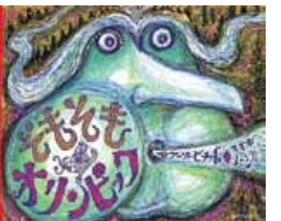
関連記事は11ページ