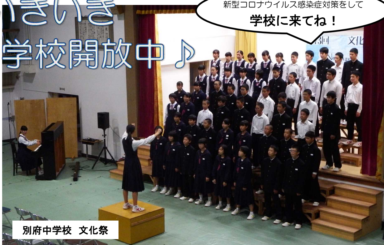
別府中学校 文化祭

県教育委員会では、平成15年度から、毎年11月1日～7日の期間を「地域が育む『かごしまの教育』県民週間」として設定しています。