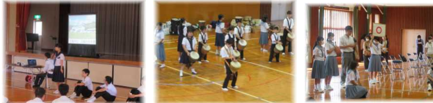
【桜山中吹奏楽部演奏】

三島村と枕崎市は、明治28年に起こった海難事故で、黒島の住民が遭難した枕崎の人々を助けたことが縁となり、「少年の船」の交流が続いています。9月28日、三島硫黄島学園、三島竹島学園、三島大里学園、三島片泊学園の4義務教育学校が修学旅行で本校を訪れ、それぞれの学校の生徒会の企画・運営で交流しました。