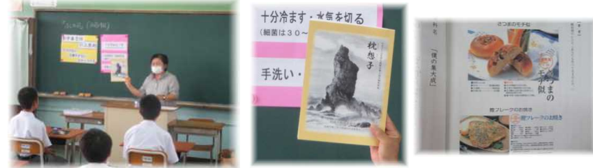
【ふしの日へ向けての学習(10/8)】 【郷土資料「枕想子」のかつお料理レシピ】

枕崎市では地元食材活用の自作弁当の日を設定しており、本校では10月19日(月)を「弁当の日」として実施します。ご家庭で地元の食材・産業、それらにまつわる習慣や料理方法等について触れる機会にしてほしいです。それぞれに「家庭の味」があるように、故郷には「地元の味」があります。この弁当の日を通して、食文化や地元に関心・興味を持って、給食を食べられていることや自然の恩恵を受けていることに感謝の心を持ってほしいと思います。