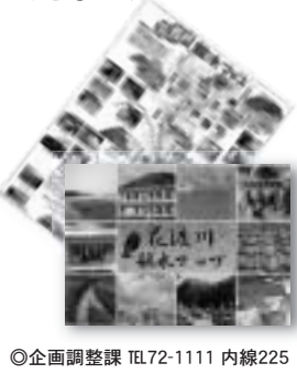
◎企画調整課 TEL72-1111 内線225

たくさんの方々の魅力にあふれた花渡川を、いろいろな角度から見つめることで、その魅力を再発見しようとして、「まくらざき花渡川親水マップ」を作成しました。このマップは「地球環境基金」の助成を受け、鹿児島市のNPO法人「まくらざき探検の会」が発行したものです。作成に当たっては、幅広い年代の市民の方々と教育委員会、市企画調整課が協力し合い、全5回のワークショップを開催。花渡川周辺の古地図や地形図をもとに、マップに掲載する自然・歴史資産情報を収集し、また、生態系の観察や簡易水質調査、写真撮影など この親水マップに掲載されている場所をめぐる体験ツアーを実施します。 日時 4月23日(土) 午前の部 10時~14時 午後の部 2時~5時 集合場所 市役所正面玄関 参加料 300円(保険料)