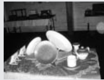
すすが付着した作品

事件当日早朝からの清掃作業に、ヒンダローベン展に出品されていた方々、市職員のほか、枕崎高校美術部の生徒さんを中心とする枕崎高校生の皆さんがボランティアとして参加していただき、館内の一部復旧に多大な協力をいただきました。本当にありがとうございました。