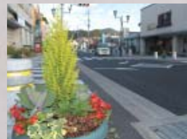
通り会の部金賞 「市役所通り会」

①カボチャを大きめのいちよう切りにして硬めにゆでる。 ②カツオを薄くスライスして鶏肉、エビを一ロサイズに切る。バターで炒め、カボチャを加え塩コショウで軽く味付けする。 ③ホワイトソースを作り、ご飯をバターライスにする。 ④ホワイトソースに②を加え、塩コショウで味を調える。 ⑤皿にバターライスと④を入れ、オープンで7~8分程度焼く。(この時、パン粉とチーズを好みで加える)