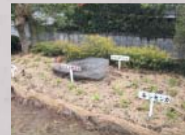
花壇の部金賞 「山口子ども会」