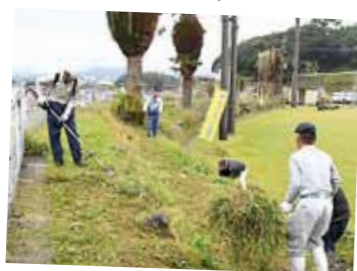
枕崎市シルバー人材センター ボランティア清掃

■10月11日、立神小学校5年生と立神中学校1年生が合同農業体験学習でいも掘りを行いました。収穫されたいもは、11月8日の給食で「さつまいものポタージュ」として、市内全小・中学校に提供される予定です。