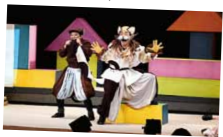
市町村による青少年劇場

■10月14日の早朝、健康づくりのきっかけを目的として、「朝ヨガのつどい」が火之神公園で開催されました。15日の夕方には、健康センターで「タヨガのつどい」も開催されました。