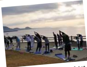
朝日を眺めながら ヨガ体験

■10月14日の早朝、健康づくりのきっかけを目的として、「朝ヨガのつどい」が火之神公園で開催されました。15日の夕方には、健康センターで「タヨガのつどい」も開催されました。