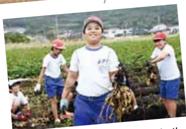
自分たちで育てた いもが給食に

■10月12日、市民会館で行われました。市内小学校の5・6年生約300名は、劇団たんばぼによる劇「グリックの冒険」を鑑賞しました。