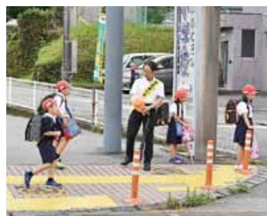
▲あいさつ運動の様子