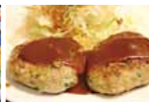
かつおtoこんぶdeうまみUPハンバーグ