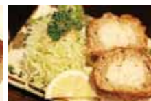
かつおメンチのばくだんコロッケ

問合せ コンカツプロジェクト協議会事務局(水産商工課内) TEL72-1111・内線421