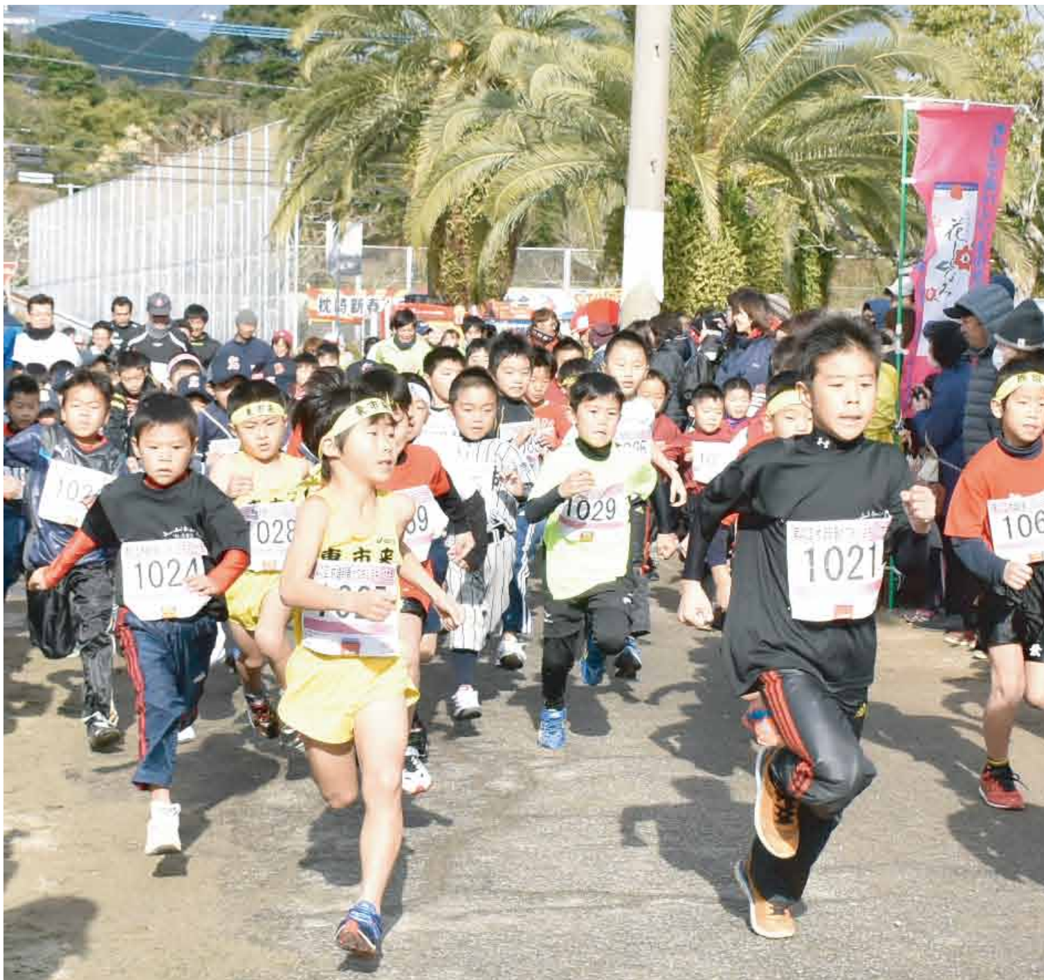
写真：第40回枕崎新春かつおジョギング大会