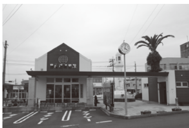
枕崎駅前観光案内所

今後39点ふやして、今年度中できるだけ早く154点を目標に努力していく。また、地場産品の中には意外な埋もれた品物等もあると思うので、一般の事業者にも呼びかけて、品目をふやす努力をしていかなければならないと考えている。