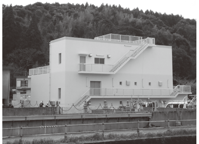
急速ろ過池更新事業により施設の更新が行われた金山浄水場

今回の補正は、人事院勧告及び人事院勧告に準じた給与改定に伴い、収益的支出において、医業費用を870万1000円減額しようとするもので、給与の減額の主な理由は、人事異動に伴って職員が1名減になったこと及び前任者と後任者の人件費の差額分が減ったことによるものであるとのことでありました。