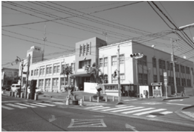
耐震工事が完了した庁舎

適正な施設規模を見きわめながら、新たな行政需要など総合的に判断していく。総量縮減、費用の平準化、施設の長寿命化などを総論的に記載し、各施設ごとに具体的には、統廃合、集約、転用、更新などを決定していく。