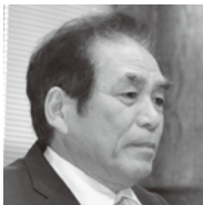
男 議員 通 占 補