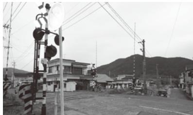
台風第16号で浸水のあった宮前地区

答 台風第16号では、1時間雨量が非常に多かった。接近し、雨が降り始めて浸水被害も起こるのではないかと心配した。