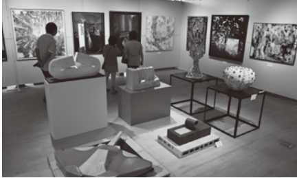
枕崎国際芸術賞展

問 国際芸術賞展が閉幕して3カ月がたつが、全体的な総括として、市長の見解は。 答 寄せられた作品について、審査の先生方が一様に質の高さに言及されていた。こういう質の高い作品がこれほど集まるというのは、大都会であつてもそんなに簡単なことではないと言われました。また、一般の入館者の方々からも、すばらしい作品に感動したと評価もいただいた。今回初めて国際公募展として開催するに当たり、さまざまな問題を解決しながら無事開催できたことは、本当にあり