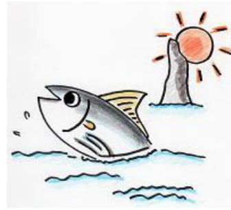
枕崎市立学校給食センターキャラクター 「カツオーシャン」