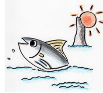
枕崎市立学校給食センターキャラクター 「カツオーシャン」