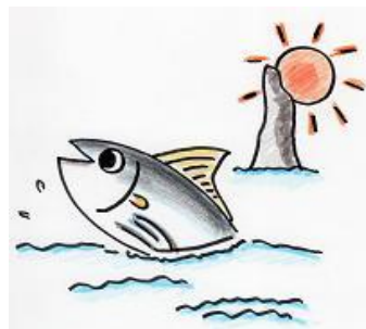
枕崎市立学校給食センターキャラクター 「カツオーシャン」