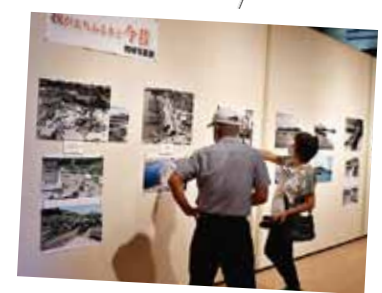
我がまちふるさと 枕崎写真展

■ 8月8日から20日までの期間、南浜館で「戦後復興75年のあゆみ～我がまちふるさと枕崎写真展」が開催されました。会場には、昔懐かしい枕崎の写真が数多く展示されました。