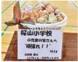
▲寄贈されたお手玉