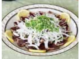
▲昼食のわら焼きタタキ

児童は、お魚センター職員によるカツオの解体ショーを見学した後、名物のわら焼きタタキの体験を行いました。その後、2階レストランでカツオのピンタ料理や自分たちで作ったわら焼きタタキを味わい、枕崎の味を堪能しました。