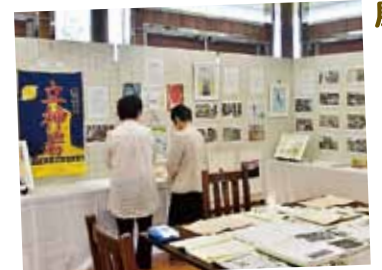
枕崎の歴史七不思議 展

■ 8月8日から20日までの期間、南浜館で「戦後復興75年のあゆみ～我がまちふるさと枕崎写真展」が開催されました。会場には、昔懐かしい枕崎の写真が数多く展示されました。