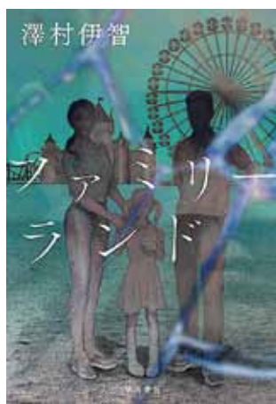
ファミリーランド 澤村 伊智 著 早川書房