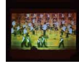
▲ライブ映像の様子

また、演奏会の様子は動画共有サービスYouTubeを通して生配信され、多くの方が演奏を鑑賞しました。