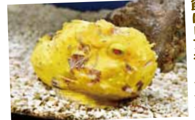
みなとの小さな水族館に レアキャラ登場

■ 今年枕崎市かつお公社が創立40周年を迎えました。8月31日に創立40周年記念として同社の駐車場にあるカツオのオブジェがリニューアルされ、お披露目されました。