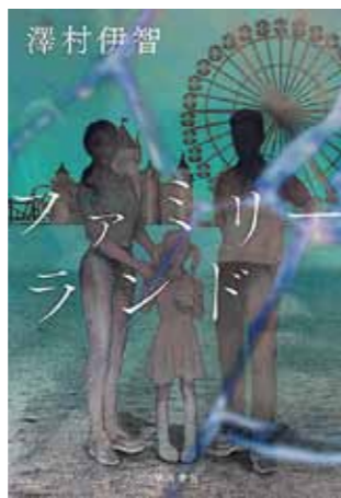
ファミリーランド 澤村 伊智 著 早川書房